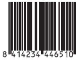
Foto del código EAN (caja)